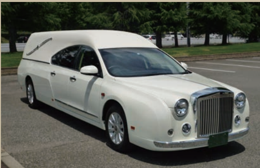
光岡ガリユー リムジン