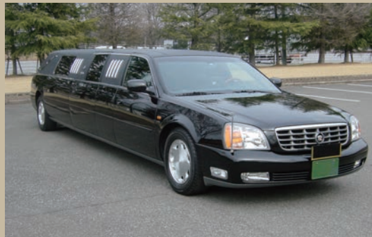
キャデラック リムジン