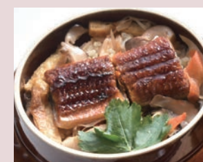
釜飯(うなぎ) 税込 1,404円