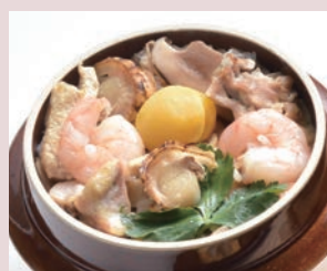
釜飯(五目) 税込 1,080円