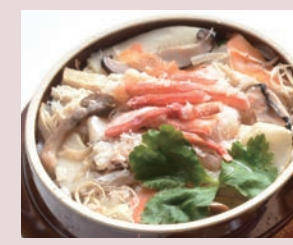
釜飯(上かに) 税込 1,404円