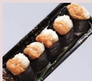
天むすび(5個) 税込 1,080円