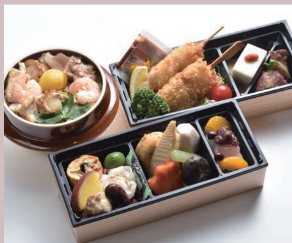
杏お包み／選べる釜飯(写真は、五目)