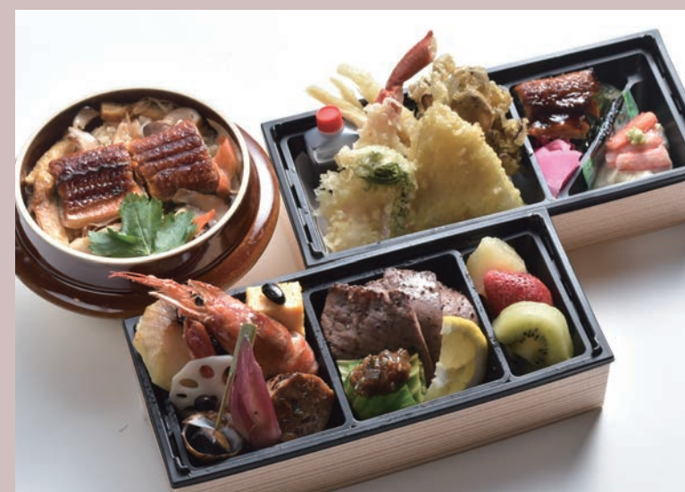
藍お包み／ 選べる釜飯 (写真は、うなぎ)