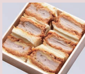
ひれかつサンド 税込 1,080円