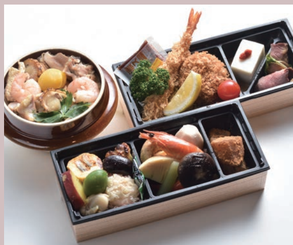
翠お包み／選べる釜飯(写真は、五目)