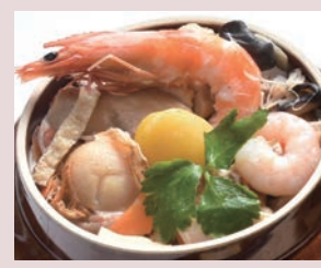
釜飯(上五目) 税込 1,404円