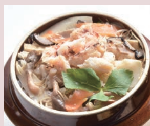
釜飯(かに) 税込 1,080円