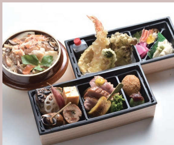
橙お包み／選べる釜飯(写真は、かに)