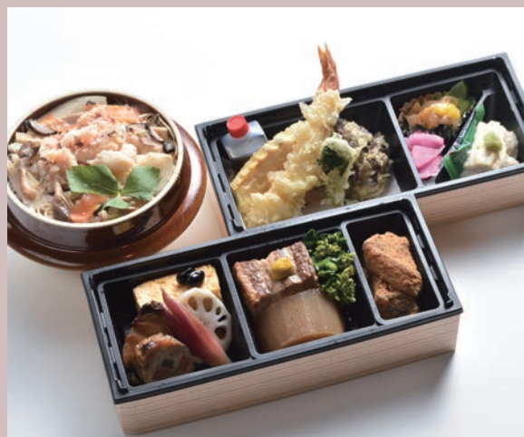
胡桃お包み／選べる釜飯(写真は、かに)