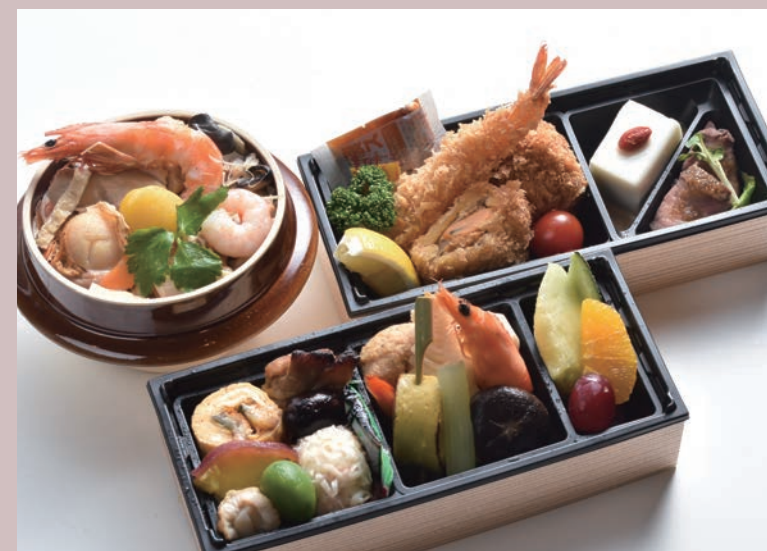
鶯お包み／ 選べる釜飯 (写真は、上五目)